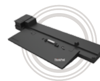
ThinkPad® Performance Dock