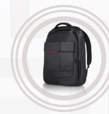
ThinkPad Professional Rucksack