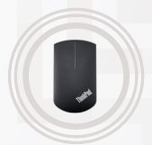
ThinkPad Precision kabellose Maus

Lenovo behält sich das Recht vor, Produktangebote und technische Daten jederzeit ohne vorherige Ankündigung zu ändern. Alle Angaben wurden sorgfältig geprüft. Lenovo haftet nicht für fehlerhafte Abbildungen, redaktionelle Fehler oder Druckfehler. Sämtliche Abbildungen dienen nur zur Illustration. Ausführliche Lenovo Produkt-, Service- und Garantiespezifikationen finden Sie auf der Website www.lenovo.com . Lenovo übernimmt keinerlei Verantwortung oder Garantie für Produkte und Leistungen anderer Hersteller. Marken: Die nachfolgend genannten Marken und eingetragenen Marken sind Eigentum von Lenovo: Lenovo, das Lenovo Logo, ideapad, ideacentre, Yoga und Yoga Home. Microsoft, Windows und Vista sind eingetragene Marken der Microsoft Corporation. AMD, das AMD Pfeil Logo sowie Kombinationen davon sind Marken von Advanced Micro Devices, Inc. in den USA und/oder anderen Ländern. Marken und Dienstleistungsmarken anderer Unternehmen werden anerkannt. Die Akkulaufzeit (und die Ladezeit) sind von verschiedenen Faktoren abhängig, unter anderem von den Systemeinstellungen und der Nutzung. Besuchen Sie www.lenovo.com/lenovo/us/en/safecompl/ , um sich regelmäßig über IT-Betriebssicherheit und -Effizienz zu informieren. ©2017 Lenovo. Alle Rechte vorbehalten.